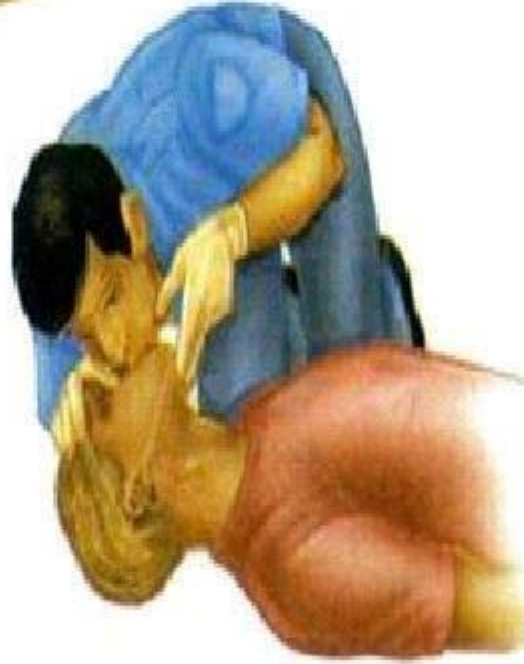
BREATHING ( SOLUNUM )