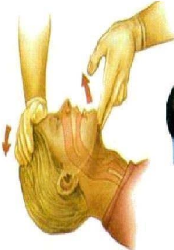
AIRWAY ( HAVAYOLU )